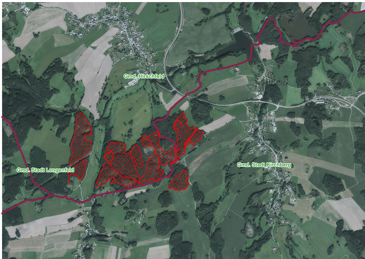
Waldteil südlich von Hirschfeld